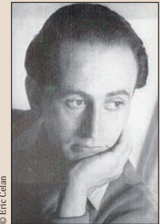
Paul Celan, Vídeň 1948

Alain Resnais, Jean Cayrol, Paul Celan, Hanns Eisler: Hluboký a adekvátně oftesný dokument o nacistických koncentračních táborech z roku 1955, který společně s hudbou Hannse Eislera a v německé verzi doplněné doprovodným textem Paula Celana zprostředkovává Celanovo celoživotní trauma z nacistického teroru ve východní Evropě.