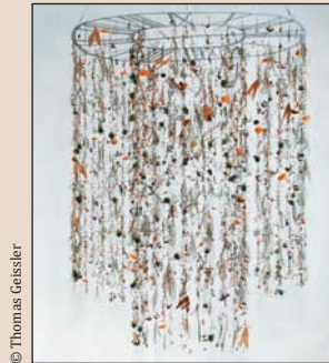
Umělecká instalace Evalie Wagner